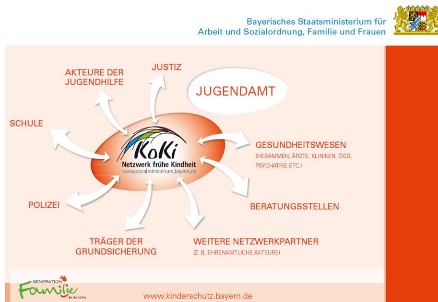
Abb.1 wesentliche Netzwerkpartner

Im Netzwerk sollen alle Institutionen aus Stadt und Landkreis Bayreuth eingebunden werden, die im Rahmen ihrer Tätigkeit mit Schwangeren, Eltern und Alleinerziehenden mit Kleinkindern arbeiten. Die nachfolgende Grafik, die vom Sozialministerium erstellt wurde, soll die wesentlichen Netzwerkpartner veranschaulichen.